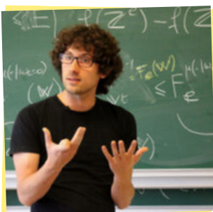
Hugo Duminil-Copin , Medalha Fields em 2022