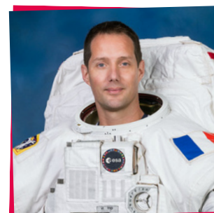
Thomas Pesquet , 10. o astronauta francês a viajar ao espaço