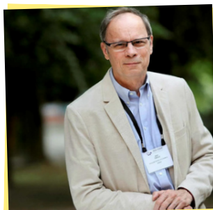
Jean Tirol , Prémio Nobel de economia em 2014