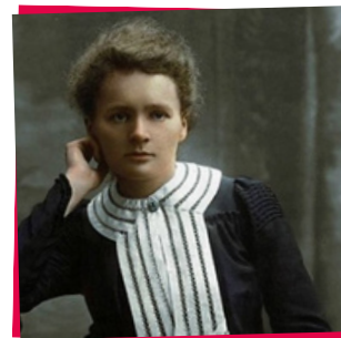
Marie Curie , Prémio Nobel de química em 1903

A França tem uma longa tradição humanista bem como de investigação e inovação científica e tecnológica que se reflete na excelência das suas formações em domínios tão diversos como o espaço, os transportes, a eletrónica, as telecomunicações, a química, as biotecnologias, a saúde e a energia, as matemáticas, sem esquecer a excelência no domínio das ciências sociais e humanidades que se manifesta nomeadamente nas áreas da filosofia, historia, antropologia, sociologias, entre outras.