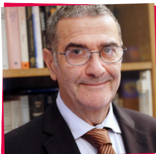
Serge Haroche , Prémio Nobel de física em 2012

→ 4. a posição mundial para prémios Nobel: até hoje, recebeu 69 prémios dentro dos seis domínios existentes