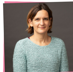
Esther Duflo , Prémio Nobel de economia em 2019